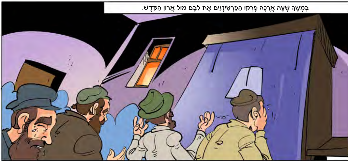
במשך שעה ארוכה פרקו הפרטיזנים את לבם מול ארון הקודש.