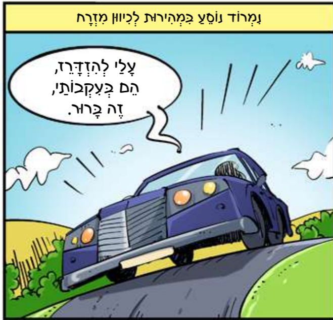
נמרוד נוסע במהירות לכיוון מזרח