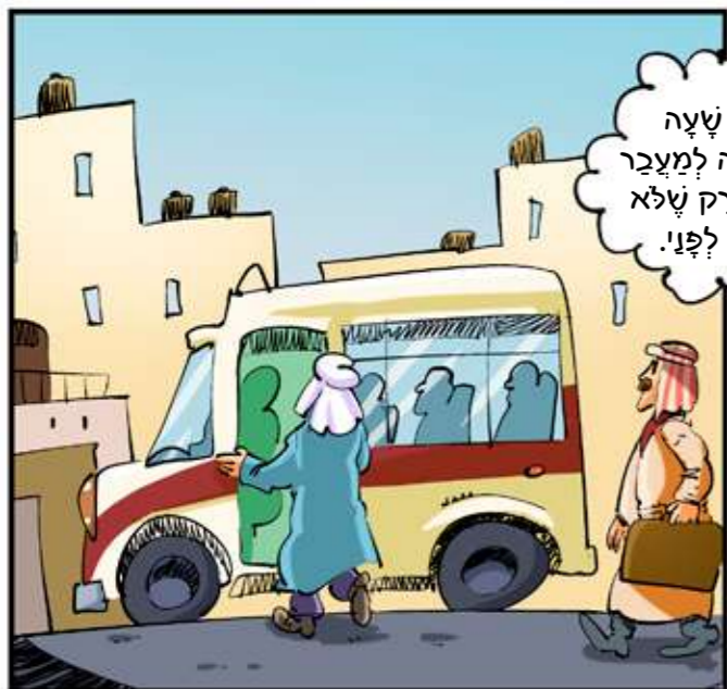
נמרוד נכנס לכפר הערבי הסמוך

עוד רבע שעה יוצאת ההסעה למעבר מנדל באום, רק שלא יגיעו לשם לפני!