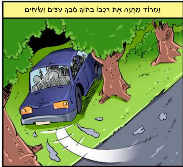
נמרוד מתנה את רכבו בתוך סבך עצים ושיחים