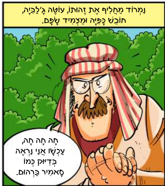
נמרוד מחליף את זהותו, עושה ג'לפיה, חובט בפיה ומצמיד שפם.

תה תה תה, עכשו אני נראה כדזיק כמו סאמיר ברהום.