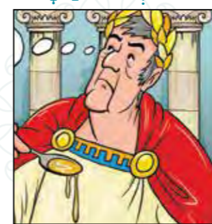
תבלין ושמו "שבת"