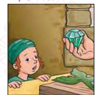
יוסף מוקיר שבת