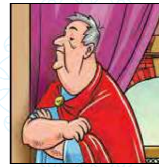
החמור שבטעט במנורה