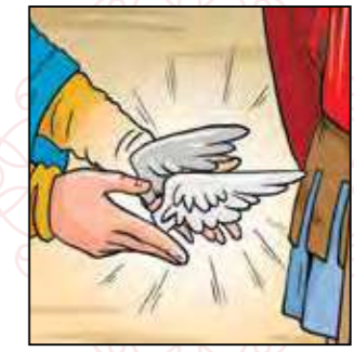
אלישע בעל הנפים