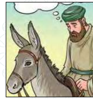
לדון לכף זכות!