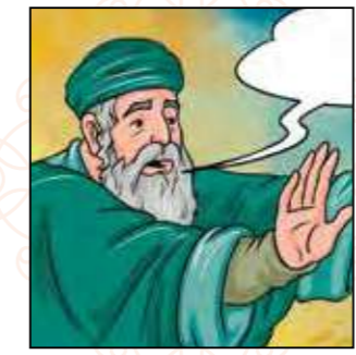
הגשם שכה את השרפה