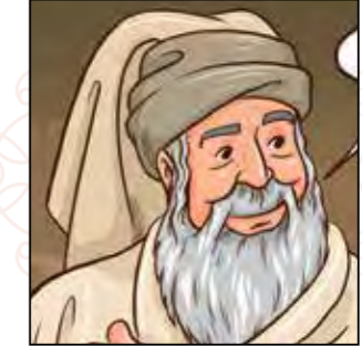
האם יכַעס הלל?!