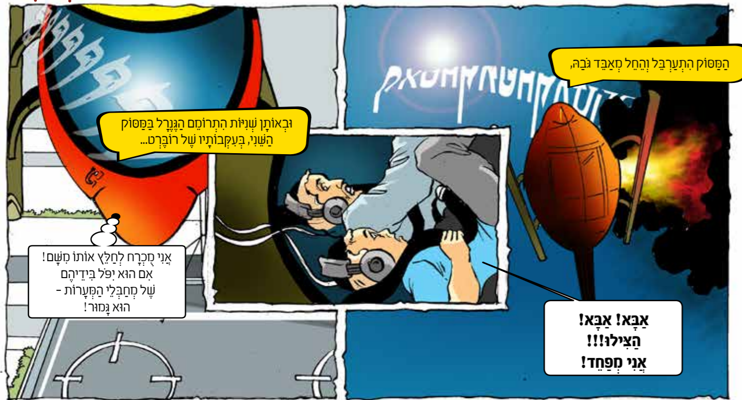
הפסוק התערבל והחל מאבד גבה,