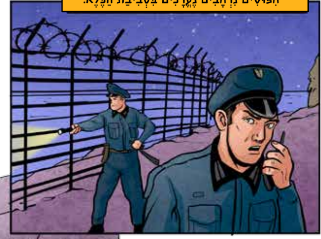
פושעים נרחבים נערכים בסביבת הפלא.