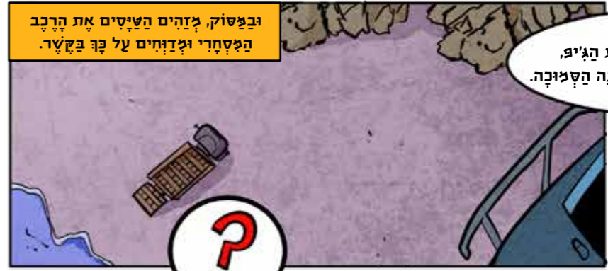
ובפסיק, מזהים הטלפונים את הרכב המסתורי ומדווחים על כך בקשר.

נראה שהם עלו עלינו, עלינו לתפס מחסה בשכונה השמיכה, אין ברירה!