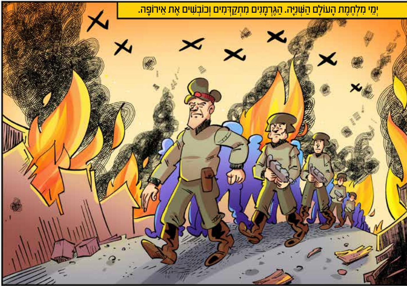
ימי מלחמת העולם השנייה. הגרמנים מתקדמים וכובשים את אירופה.