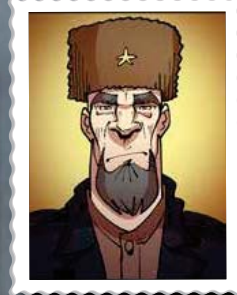
דימה קצין סובייטי אכזר ורע לב במיחד הממנה על אחד ממתנות האסירים בסיביר. אחת ממשרותיו הנה להשמיד קל זיק יהודי מעל פני האדמה.