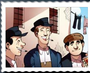
נצרי שוליס שלושה נצרים שרדו מנהדתם בעקבות שמיל נץ, בתקופת התרחקותו מדרך אבותיו. השלושה לא זכו לטוב בתשובה.