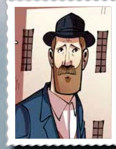
שמיל נץ יהודי פרטי שבוצעו התרחק מדרך אבותיו ולאחר מכן שב למושב. בתהפוכות חייו הפסיעות הוא מתגלה בגבורת ונפשו ובתשיותו.