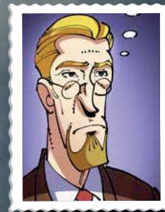
הנס רופא ממחה, שלבו שחר משהו. מתמט לחזותו החביבה הוא רוקם עבור שמיל ורעייתו תכניות דדוניות במיחד.