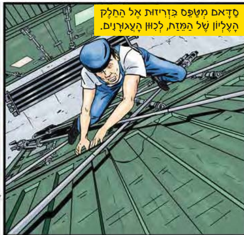
סדאם מטפס בזריזות אל החלק העליון של המזח, לכוון העגורנים.