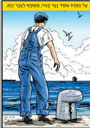
על המזח עומד וצר צעיר, משקיף לעבר הים.