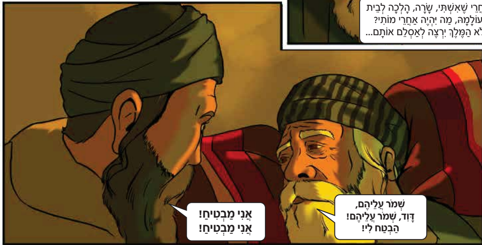
אני מבטיח! אני מבטיח!