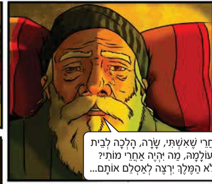
אחרי שאשתי, שרה, הלכה לבית עולמה, מה יהיה אחרי מותי? הלא המלך ירצה לאסלם אותם...