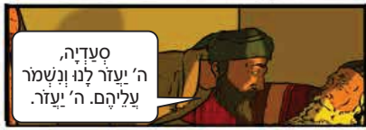
סעדיה, ה' יעזר לנו ונשמר עליהם. ה' יעזר.