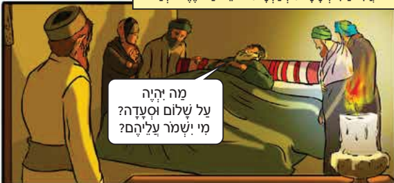
מה יהיה על שלום וסעדיה? מי ישמר עליהם?