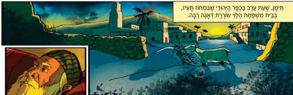
תימן, שעת ערב בכפר היהודי שבמחוז תעז, בבית משפחת הלוי שונרת דאגה רבה.