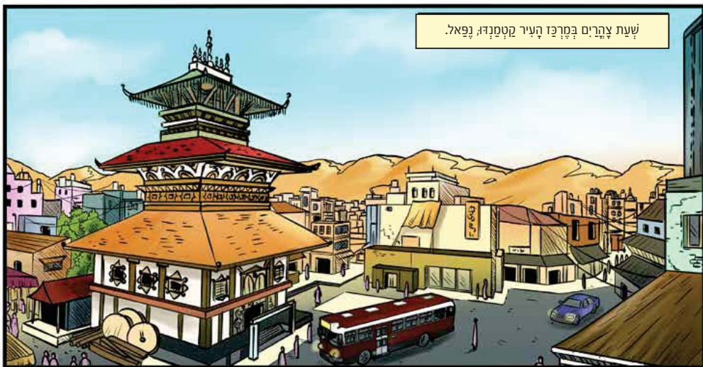
שעת צהרים בפרוז העיר קטמנדו, נפאל.