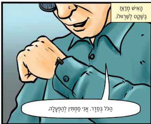
האיש מדגם בשקט לשרוולו.