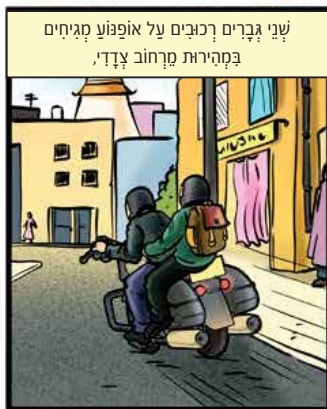
שני גברים רכובים על אופנוע מגיחים בקהירות מרחוב צדדי.