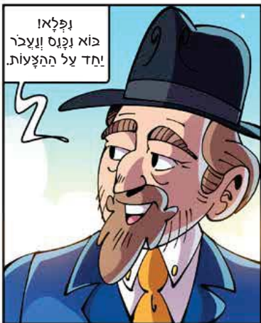
נפלאו בוא וקנס ובער! חד על ההצעות.