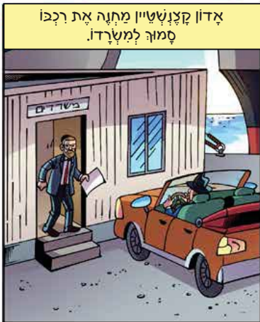
אדון קצנשטיין מחנה את רכבו סמוך למשרדו.