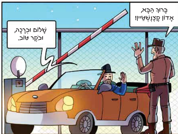
ברוך הבא, אדון קצנשטיין!