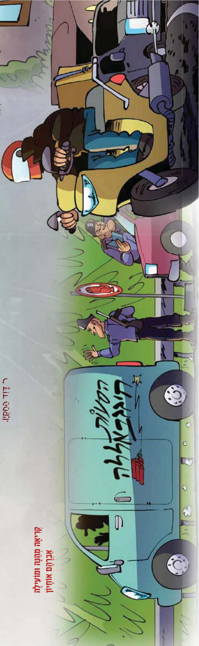
קריאה מתונה ומודעיקה אברהם אוחיון

במאמץ? אמנם לא? או אולי? או לא? אולי? או לא? או לא? אולי? או לא? או לא? אולי? או לא? או לא?