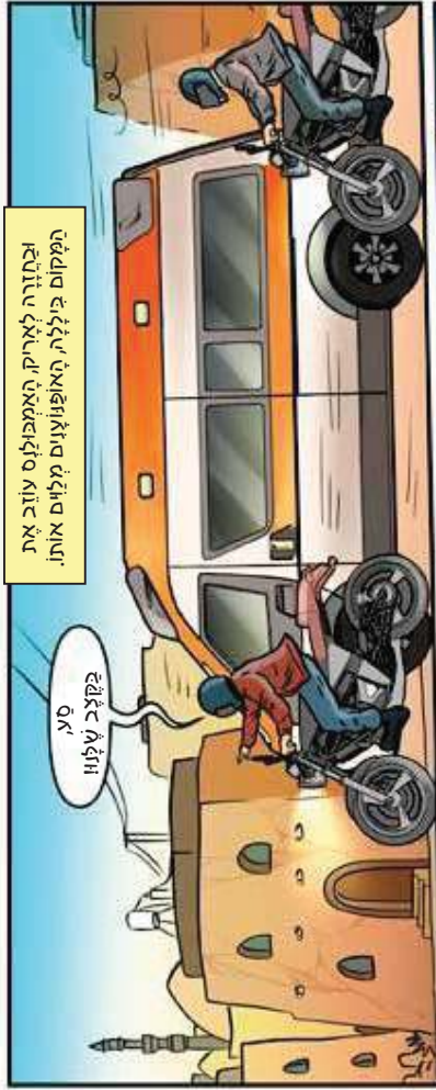
הכורה לאריו, האמבולנס עוזב את המקום בגלל האופוזיצים מלוים אותו.