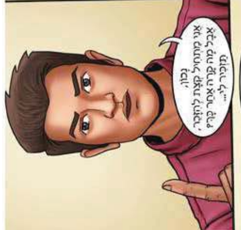
אני מותחיל קצת לחוצר, אבל מה קרה אתר בקר, תסביר לי...