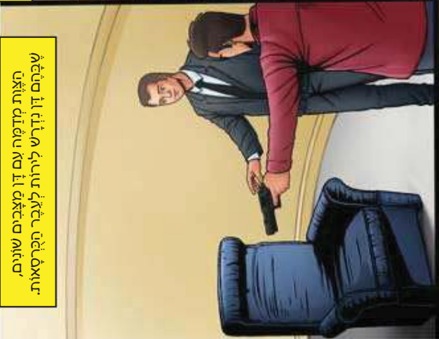
האות מדומה עם דן מצבים שונים, שבהם דן נדרש לירות לעבר הפרסאות.