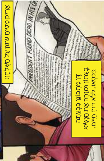
אריק מטוח עתנו על השליון: