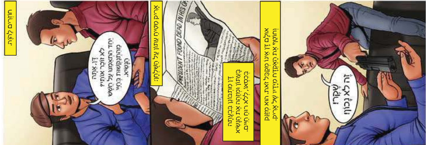
זה לא נכון ורלמה