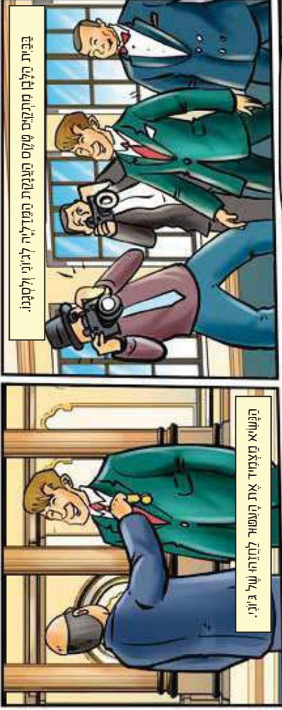
בבית הלבו מומחים טקס הענקת הפרס לזינו ולסגנו.