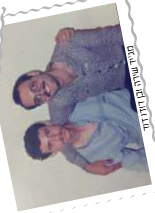
מגיד שירה ובו דודוד