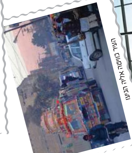
העיר כווסטה אליה הגיעו