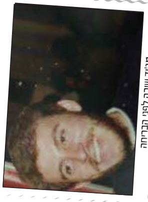
מגיד שירה לפני הבריחה