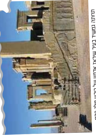
החנה גמשיד בעיר שריאה ארמון של כורש מלך פרס