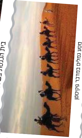
מסע גמלים במדבר פקיסטן