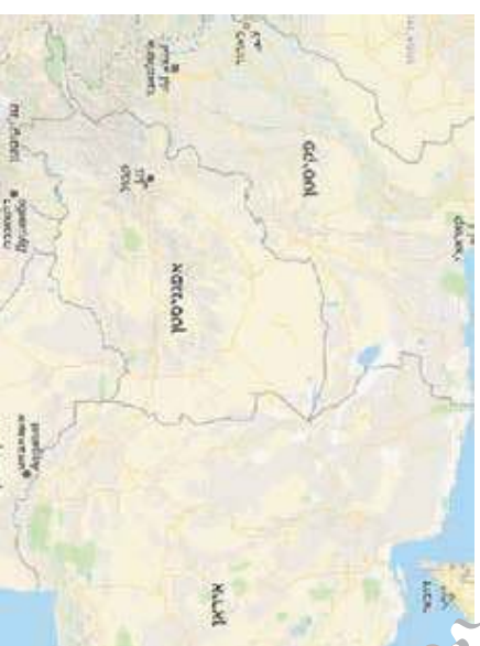
מסלול הבריחה מאוראן עד פקיסטן, אסל אמאבד