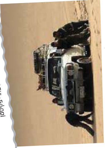
מחלצים את הגיפ מהחולות