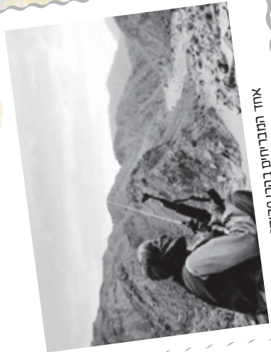
אחד הפבריוס בהרי פקיסטן