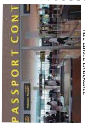
שדה התעופה באסלאמאבד, העבירו דרכן מחוף בצרף מאה דולר ...