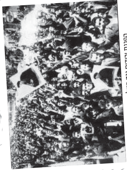
הפגנת יהודים נגד המלך, באשורו