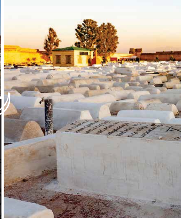
בית העלמין היהודי במרקש