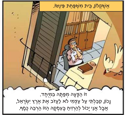
אשקלון, בית משפחת פינטו.

זו הנצעה מפתה במיוחד. וכוון קבלתי על עצמי לא לעזוב את ארץ ישראל, אבל אני יכול להרוויח בעסקה הזו הרבה כסף.