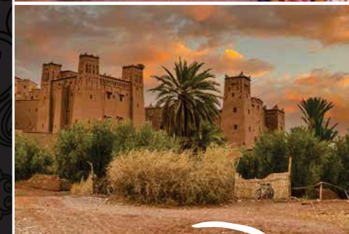
בתים כפריים ליד מרקש