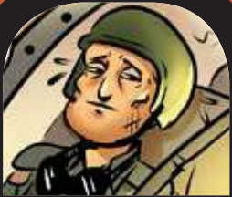
ירון להו טיס ישראליו שנחשב לחלל שמקום קבורתו לא נודע במשך שמונה שנים.