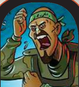
יאסר אבו עדיז מפקד ארגון הטרור תמאס בעזה, לכידת הישיבשרים הישראלים הנה אחת ממשימות תיו.